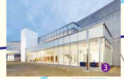
●清須市立図書館 ● 夢広場はるひ 美術館や公園を一体とした清須市の文化ゾーンとして広く利用されています。