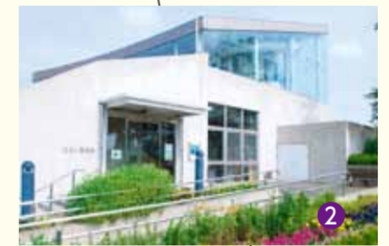
●清須市はるひ美術館 ● 夢広場はるひ 静かな公園の中にある二階建てのおしゃれな建物。美術・芸術に触れていただく場です。