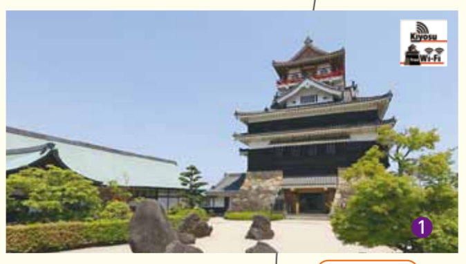
●清洲城主館 ● 清洲城 織田信長公が拠点としたことで知られます。「清須会議」が行われたのもここ。現在の天主閣は、平成元年に建築され、趣向を凝らした展示などで清須の歴史に触れることができます。